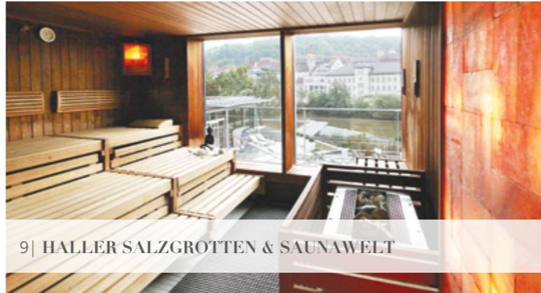
9| HALLER SALZGROTTEN & SAUNAWELT