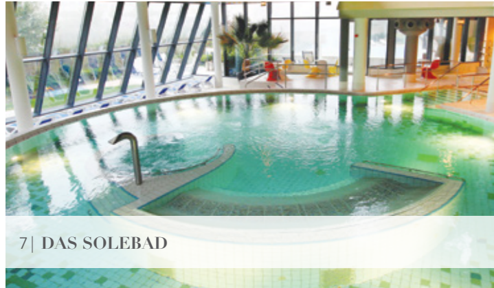
7| DAS SOLEBAD