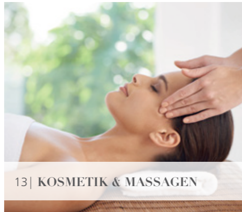
13| KOSMETIK & MASSAGEN