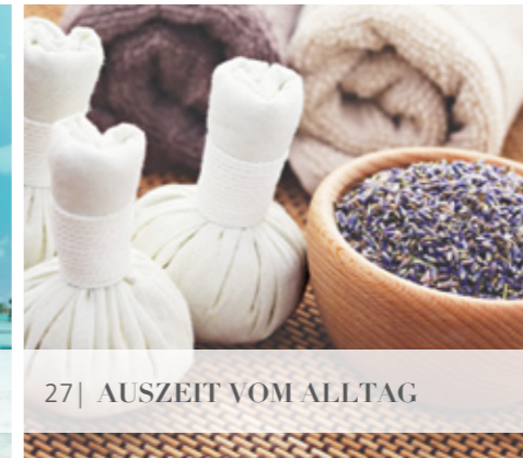
27| AUSZEIT VOM ALLTAG