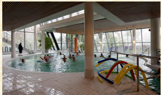
Vital-Rundbecken mit heilsamer Haller Sole, Luftperlbank und Strömungskanal.

Solebad: Mo.-Fr. 8.30–21 Uhr, Sa./So. 8.30–20 Uhr Sauna: Mo. 13–21 Uhr, Di.-Fr. 9.30–21 Uhr, Sa./So. 9.30–20 Uhr